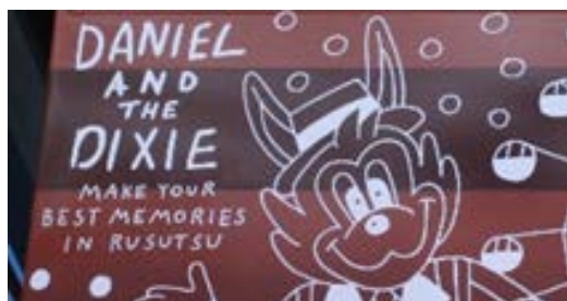
↑オリジナルキャラクター ダニエル